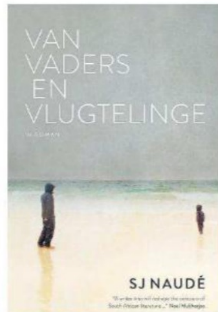
Die skrywer S.J. Naudé is benoem vir sy roman Van vaders en vlugtelinge , wat die UJ-prys vir Afrikaans gewen het.