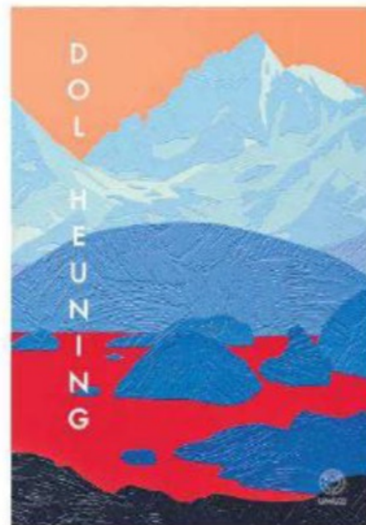
Naudé is ook benoem vir sy kortverhaalbundel Dol heuning , wat in 2022 met die UJ-prys vir Afrikaans vereer is.